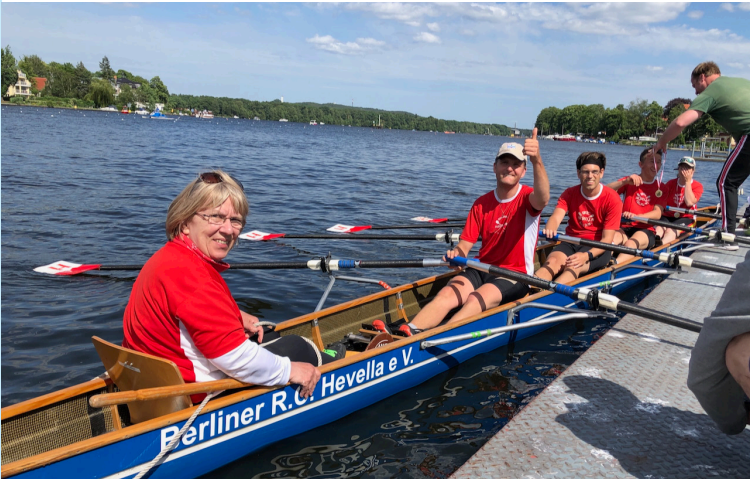
Der Berliner Ruder-Club Hevella und der Ruderclub Rapid Berlin sind Vorzeigevereine im Inklusionsrudern.

Selbstverständlich können auch Menschen mit Beeinträchtigungen rudern. Das gilt für Leistungs- und Breitensport gleichermaßen. Para- und Inklusionsrennen stehen seit vielen Jahren auf dem Programm der Berliner Regatten. Nicht alle Vereine bieten Para- und Inklusionsrudern an, weil besondere Anforderungen an die Bootshäuser und das Material nötig sind. Unsere Geschäftsstelle hilft gern bei der Suche eines geeigneten Vereins.