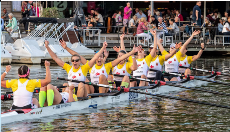
Die Ruderinnen des HavelQueenAchters (Ruder-Union Arkona Berlin 1879 / Ruder-Club Tegel 1886) sind mehrfache Siegerinnen der Ruder-Bundesliga.

Kontakt: Landesruderverband Berlin, Jungfernhedeweg 80, 13629 Berlin, Tel. 030 - 30 64 00 00