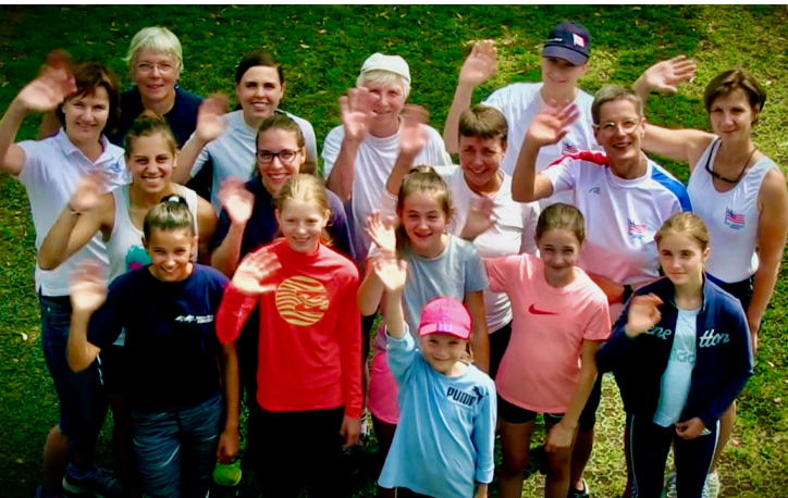
Rudern macht auch Mädchen viel Spaß. Das zeigt unser kurzes Video: bit.ly/Mädchenrudern